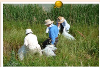
▲毎月1回油ヶ淵湖岸でゴミ拾 いを行います。クリンピー(碧南 市のキャラクター)もゴミが減る ことを願っています。