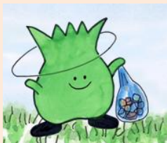
▲クリンピー 市政60年を記念し た紙芝居にも登場し ています。

そのなかの1グループでは 「よみがえれ油ヶ淵」を合言葉 に、毎月1回、油ヶ淵の水質調 査及び、水辺のごみ拾いを行っ ています。 日頃熱心に活動していただい ており、碧南市の自然環境をよ り良くしたいという熱意が伝わ ってきます。心から感謝してお ります。