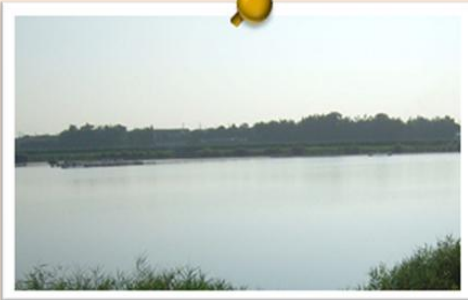
▲6月の油ヶ淵。田植え準備のため 少し濁っていますね。

こんにちは。碧南市役所環境 課環境保全係です。今回はへき なん市民会議の活動を紹介しま す。この市民会議の委員は、碧 南市環境基本計画の目標達成に 協力しようと集まった環境に関 心のある事業者の担当者や市民 約30人です。平成16年8月か ら毎月2回会議を開催し、現在 に至っています。また、3つの グループに分かれそれぞれ活発 に活動しています。