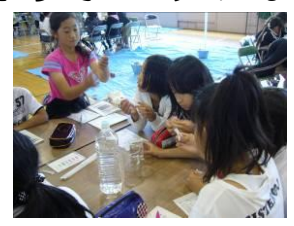
みんな真剣にCODをパックテストで測っています。実験は上手なもの。

そしていよいよ、よこれを調べるために使うCODパックテストの実習。前にやった事があるよって子が何人もいて、「さすがー」って驚き。そのためか、調査の実習はとってもスムーズお手のもので手早い。