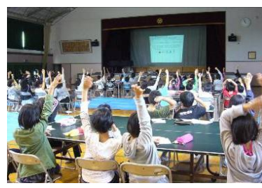
質問に元気よく答えてくれていました！

クイズにもみんな元気に手を挙げてくれて、ちゃんと聞こえて気持ちがいいじんぶん伝わってきました。