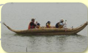
「新たに制作した葦船「夢丸」。 油ヶ淵の中をスイスイ進んで いくよ。これまでの葦船3隻と 合わせて、葦船レースができたら面白 いと思うな！やっぱり小型の「ちい まる」が速いのかなあ？」

今回の葦船はちょっと太っちゃよ。み んなの夢をたくさん乗せていけるよう に「ゆめまる」と命名。進水式では勢 いよく出航していったよ。 今度また10月29日(土)に、油ヶ淵 で葦船4隻での乗船会を開催するんだ って。ほくも得意の泳ぎで、葦船と競 争したいな！ (あぶちゃん)