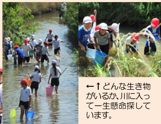
←↑どんな生き物がいるか、川に入って一生懸命探しています。

油ヶ淵への流入河川の二つである朝鮮川。西尾市立米津小学校では、身近なこの川を舞台に水環境について考える川の学習を4年生の総合的な学習で行っています。これは、社会の授業で「汚れた水の処理」について勉強することの関連性も考えて行われているものです。