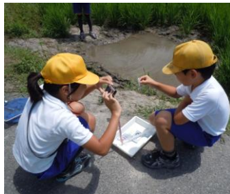
「水路や田んぼの水質をチェ ック！結果はデジカメで記録 します。」

生きものにとっても詳しい小鹿先生の もつで、元気がいっぱいに活動してい る今池小学校のみんなの姿を見ることが できました！ (嶋田)