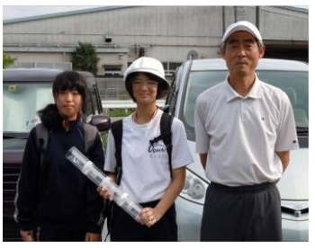
▲活動後に記念撮影！少数精鋭のメンバーで、がんばりました。