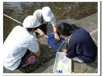
▲小さな魚が泳いでいるのが見えても、タモでつかまえるのは大変！この日は、ヒル、アメンボ、アマガエルなどをみつけました。

7月26日(木)、大口町立大口中学校科学部の活動を取材しました。大口中学校は、平成20年に、2つの中学校を統合してできた新しい学校で、丹羽郡大口町のほぼ中央にあり、