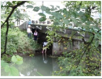
▲大口町内で最も上流にあたる調査地点で採水の様子。調査では、手作りの機材が大活躍！

▲亜硝酸態窒素の値を7月と比較すると、稗田川で大きくなっているほかは余り変動していませんでした。