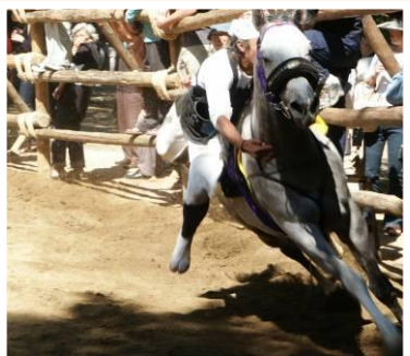
「おまん」と祭りの様子。写真からも疾走感が伝わってきます。ぜひとも、間近でみてくださいね。

春日神社境内で行われる「おまん」とは市の無形民俗文化財に指定されており、馬場の円周も約9メートルと大きいため馬のスピードも速く、よその「おまん」とは迫力が違ってしまうようです。