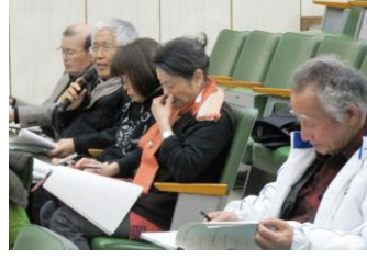
▶意見交換会の様子。

今年度は県で実施している水質調査関係や放射線モニタリング関係について分析室や測定機器等の見学をしました。その後、平成17年度から実施している油ヶ淵流域水環境モニタリングについて、市民グループのみなさんと一緒に意見交換をしました。地域のことについてお話を伺うことができ、より一層の理解を深められる機会となりました。