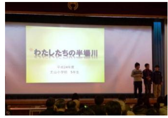
▶文山小学校5年生による発表の様子。

平成25年2月9日(土)に、安城市南部公民館で、「油ヶ淵流域の環境を考える集い」がエコネットあんじょうの主催で開催されました。