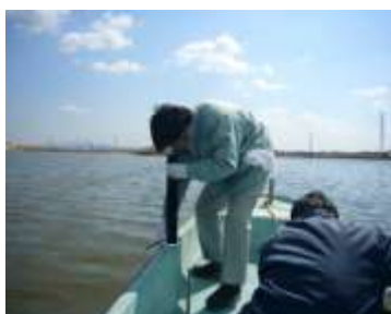
油ヶ淵湖上での測定の様子

測定は誰にでもできる方法ですが、測定する人の視力に左右されるため、2割程度の誤差が生じることがあります。したがって同じ人がはかるか、数人で測定する場合は平均値を出すによいです。