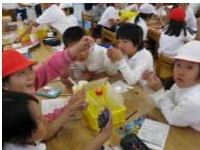
CODパックテスト実施の様子 調整・生活排水グループ 平野

米津小学校のみんなさんが安心して川に親しめる様な朝鮮川にしていきたいと思います。