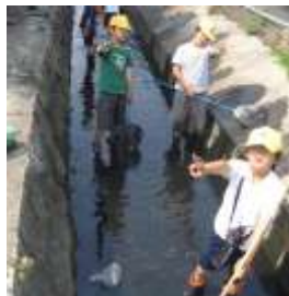
「水路での生き物調べ」 棚尾の水質パトロール隊