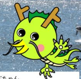
あぶちゃん (油ヶ淵マスコットキャラクター)