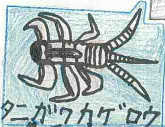
タニガワカゲロウ