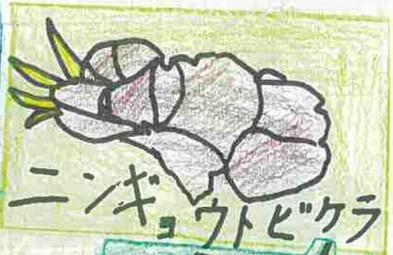
ニンギョウトビクダラ